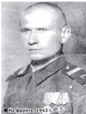
● На фронте. 1943 г.

Истоки династии восходят к началу XX века, к г. Баку. Именно туда из Рязани осиротевшего двенадцатилетнего подростка Сашу забрал родной брат. Учёба ему не давалась, поэтому он попросил брата устроить его к себе на нефтедобывающее предприятие. Юношу взяли учеником токаря.