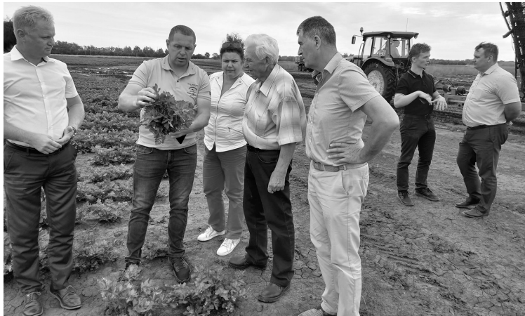
● Осмотр посадок сельдерея на песоченских полях.

— ООО «Весна» работает в этом направлении. В этом году на поле, под укрытием материал, высажены мини-клуб-