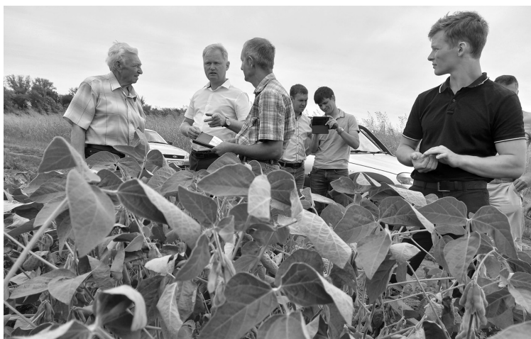
● Демонстрационная делянка сои Самарского НИИСХ.

ни отечественной и импортной селекции. ГК «Самарские овощи» приобрела здание кукурузно-калибровочного завода, где в настоящее время формируется биотехнологическая лаборатория по производству безвирусного семенного картофеля. Мы также подали заявку на участие в качестве заказчика в подпрограмме «Развитие селекции и семеноводства картофеля в РФ» в рамках федеральной научно-технической программы по селекции и семеноводству отечественных сортов картофеля в России. Работать в данном проекте будем совместно с Самарским НИИСХ