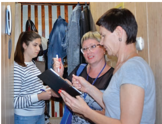
• Адресное информирование в доме № 164а по ул. Советской проводит УИК № 0207.

Члены УИК посетят каждую квартиру, каждый дом на закреплённом избирательном участке, что- бы встретиться и побеседовать с проживающими там избирателями. Приоритетное внимание уде-