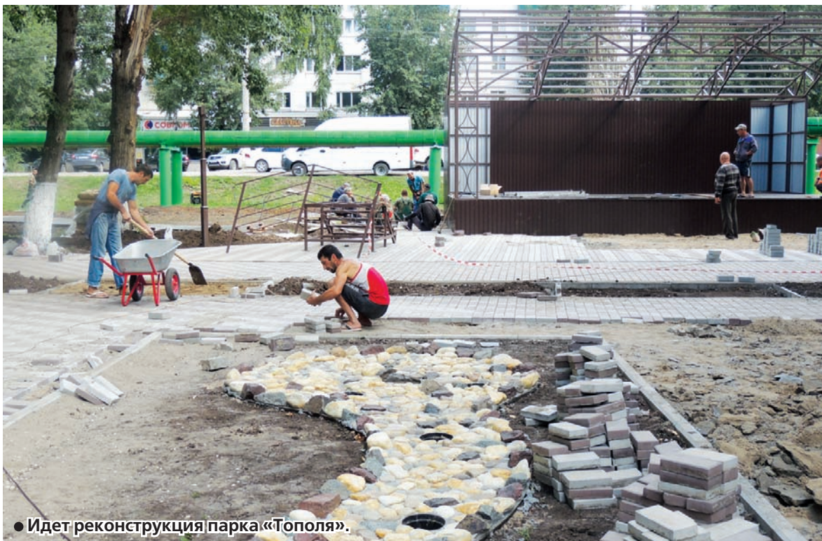
• Идет реконструкция парка «Тополя».

Традиционно, в начале августа мы поздравляем с профессиональным праздником всех строителей 2 окончание >>