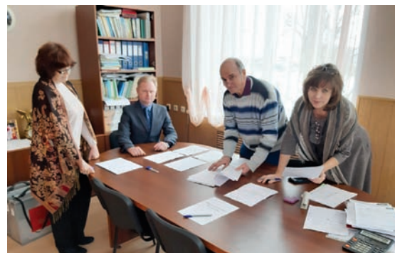
● В Самарском НИИСХе идет подсчет голосов.